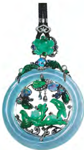
“工艺组” 优异奖作品《梦映鹊桥》 设计师：谢佳谕