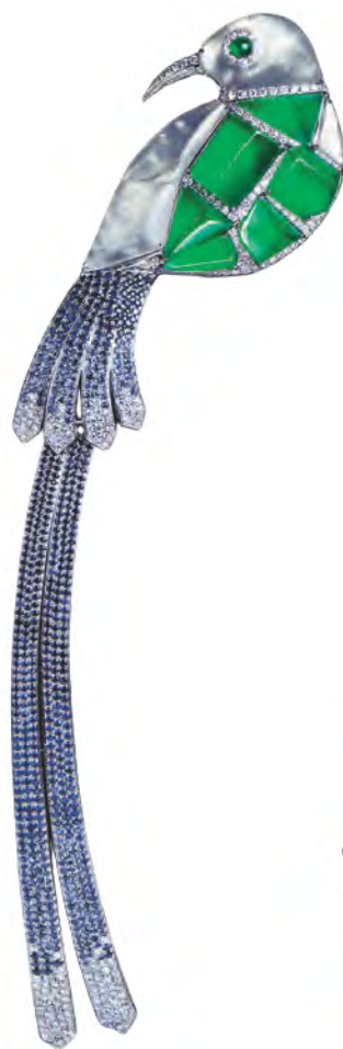
“光芒再现组”优异奖作品《翠羽蓝雀》 设计师：李莉