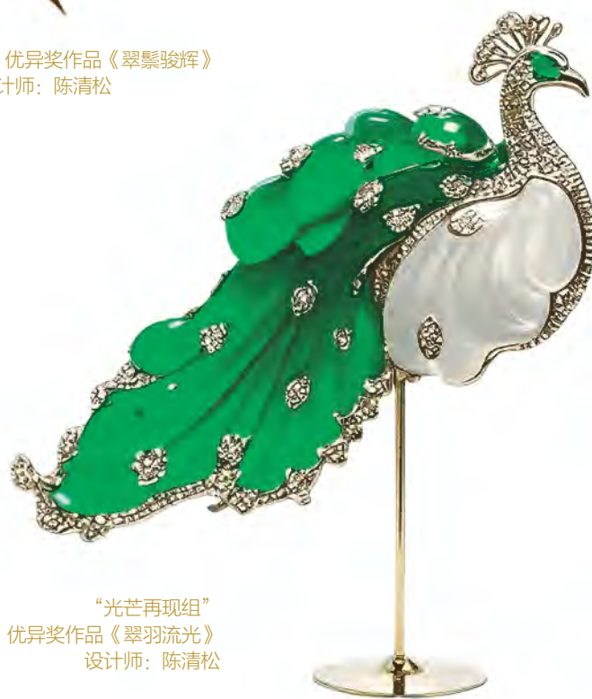
“光芒再现组” 优异奖作品《翠羽流光》 设计师：陈清松