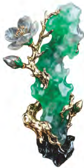
“创意组”优异奖作品《梅傲翠宇》 设计师：杨志