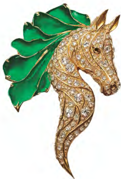
“光芒再现组” 优异奖作品《翠鬃骏辉》 设计师：陈清松