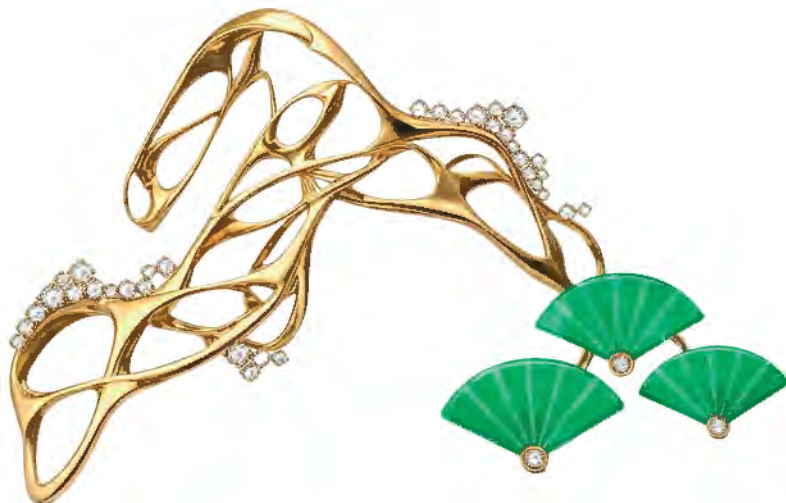
“创意组” 亚军作品《马上成功·四季常春》 设计师：梁樊