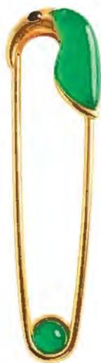
“创意组” 冠军作品《候鸟》 设计师：余悦衍

翠首饰行业亟需接纳新思维，唯有在观念上打破藩篱，方能实现真正的突破与变革。“无论是坚守传统手绘的细腻表达，还是借助AI等数字工具探索未知边界，只要能够清晰地传递出设计理念与个人风格，都值得我们鼓励与喝彩。”他欣喜地表示，本届创意组参赛作品风格多元、表现亮眼，整体水准令人惊喜，充分展现出年轻设计力量的开放视野与创新精神，也为翡翠这一古老材质注入了更具时代感的表达语汇。CC