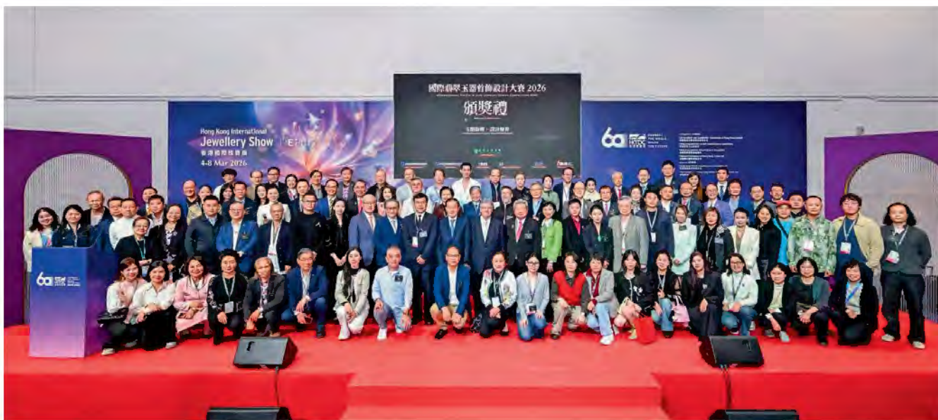
“国际翡翠玉器首饰设计大赛 2026”颁奖典礼大合影