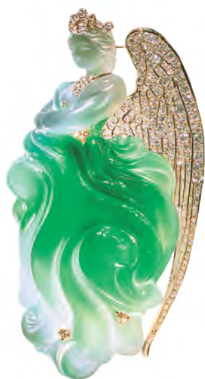
“创意组” 优秀奖作品《天使的悲悯》 设计师：陈清松