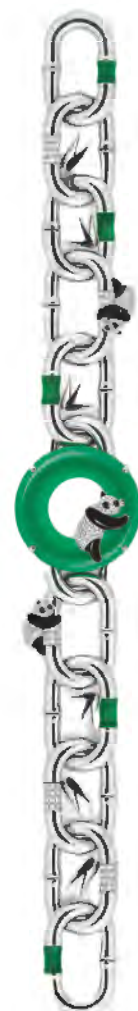
“创意组” 优秀奖作品《玉见熊猫》 设计师：梁樊