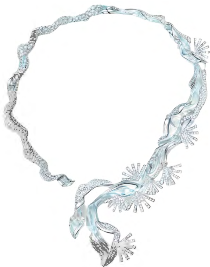
“创意组” 优秀奖作品《意度天成》 设计师：梁樊