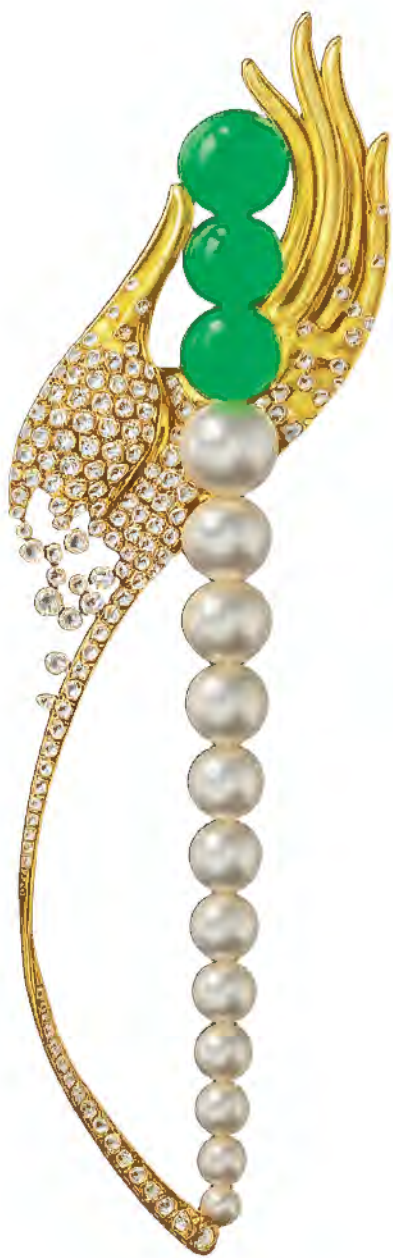
“光芒再现组” 优异奖作品《念心·心念》 设计师：郭芯语