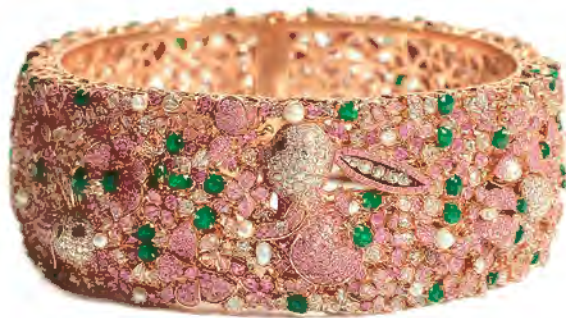
“工艺组”优异奖作品《Best wish 兔 You》 设计师：姚磊