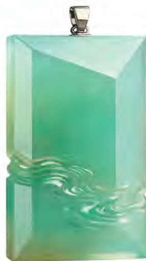
“光芒再现组” 优异奖作品《玉棱流水》 设计师：刘彬斌