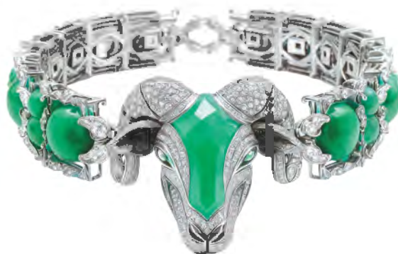
“创意组” 优秀奖作品《初阳》 设计师：丘红