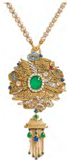
“工艺组” 优异奖作品《鹤舞云阙》 设计师：南京宝姐有限公司