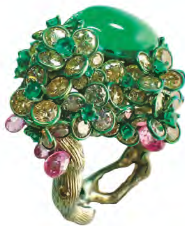
“工艺组” 季军作品《碧潭隐翠》 设计师：蔡安和