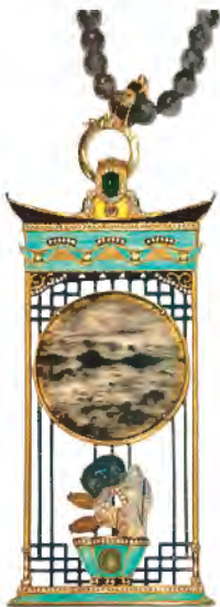
“工艺组” 优异奖作品《玉茗堂前》 设计师：谢佳谕